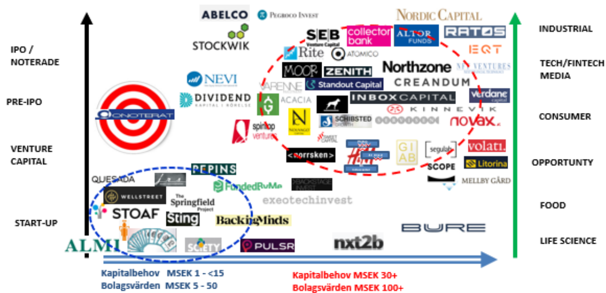
Bild 1. Marknadsposition Onoterat AB (publ)